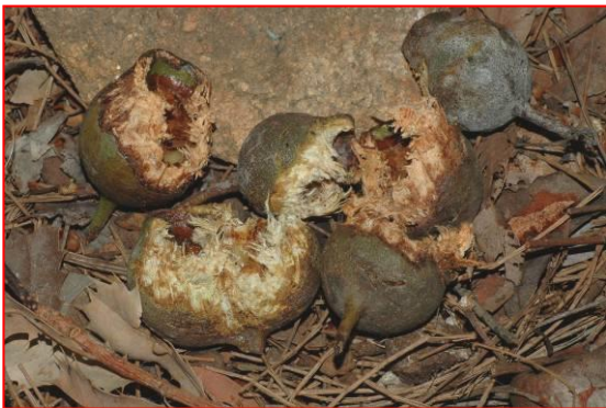
Nueces Marri masticadas por la Cacatúa Fúnebre de Cola Roja del Bosque